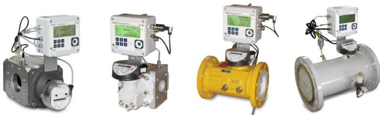
Комплекс СГ-ЭК-Р Т